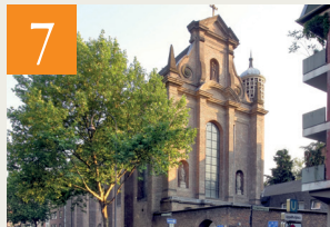
Sankt Maria in der Kupfergasse