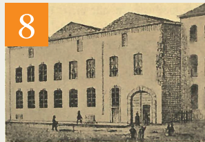
Gesellenbospiz, Breite Straße